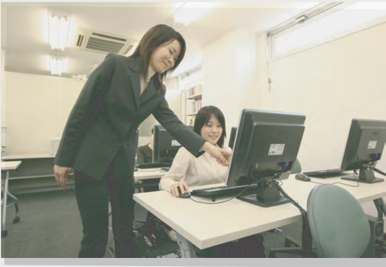
▲ うれしいフリータイム制・マンツーマン授業

手書き図面をデータ化する「CAD オペレーター」は、近年需要が増加してきており、派遣の需要も高まっています。